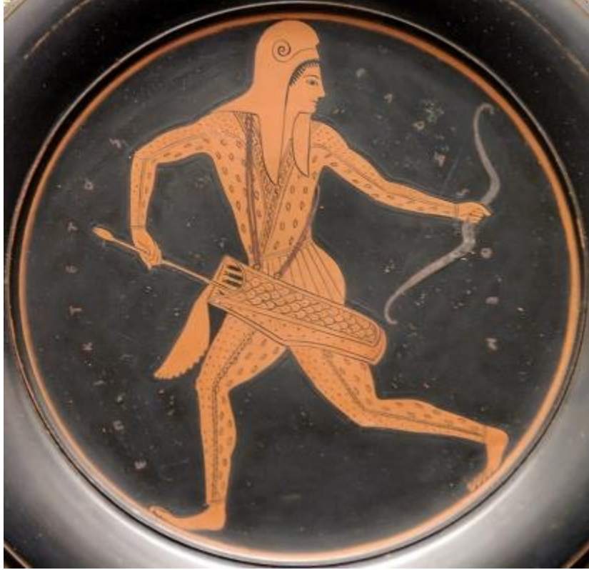
Arquero escita c. 500 a.C.

Los escitas eran caucásicos. ¿Dónde podrían estar hoy?