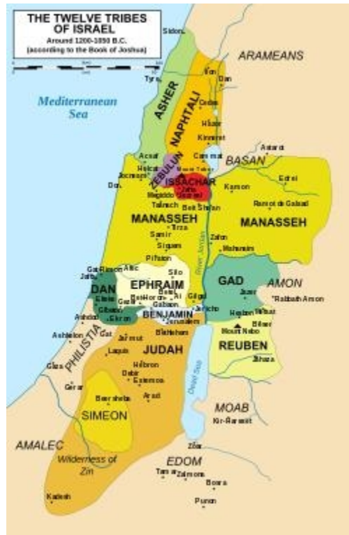
Antiguo Israel mostrado con las fronteras de las tribus

El hecho es que Zabulón estaba casi tan lejos de cualquier mar como podría estarlo cualquier tribu en ese mapa. Es una de las tribus menos probables de ser un "refugio para barcos" en su antigua ubicación en Tierra Santa.