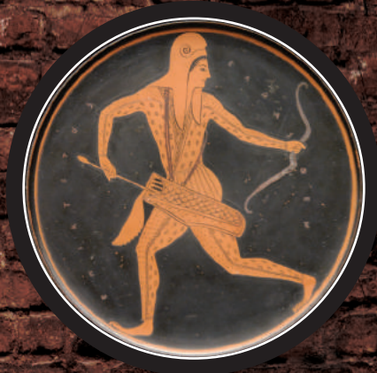
Arquero escita c. 500 a.C.

La historia indica que las 'tribus perdidas de Israel' fueron, por un tiempo, a Escitia. Aquí hay una representación de un escita en cerámica antigua: