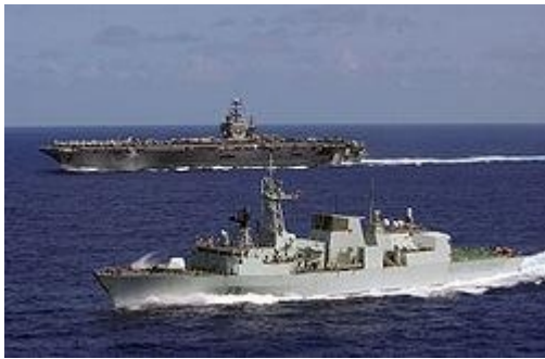
Buques de guerra canadienses y estadounidenses

Y ni América Latina, ni los países del Caribe no español parecen capaces, a estas alturas, de tener una fuerza naval que detuviera al Rey del Norte. Por lo tanto, observar y comprender los eventos mundiales actuales, como aconsejó Jesús, (por ejemplo, Marcos 13: 32-37) deja en claro que el poder naval tendría que ser los EE.UU. y posiblemente incluir también uno o más de sus aliados de habla inglesa.