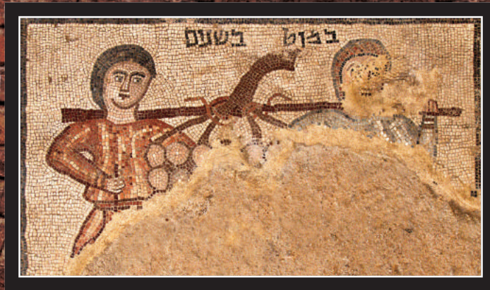
Representación de Números 13:23

¿Cómo eran los judíos antiguos? Aquí hay un mosaico de un pueblo judío en el Imperio Romano tardío que representa a los antiguos Israelitas: